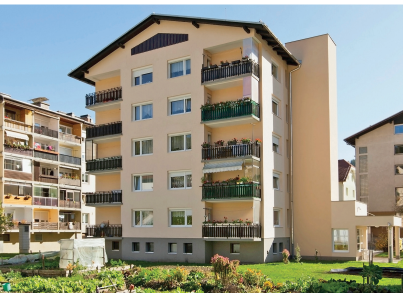
Prevalje, Trg 37, obnova objekta in dograditev dvigala, 2010