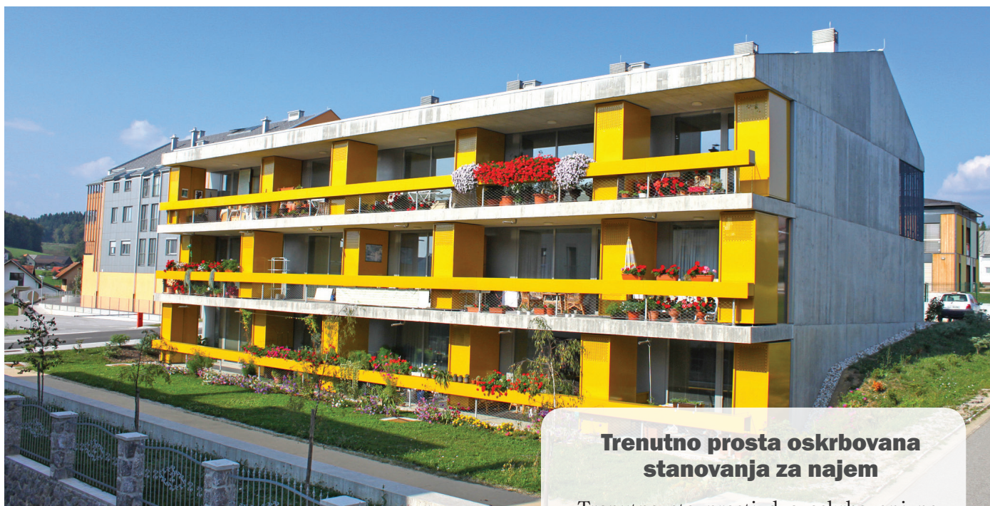
Oskrbovana najemna stanovanja Trebnje, Režunova ulica 12

Vabimo vse zainteresirane upokojece in druge starejše, ki želijo rešiti svoje stanovanjsko vprašanje, da oddajo vlogo. Za informacije in vloge se obrnite na lokalno društvo upokojujencev ali na Nepremičninski sklad PIZ.