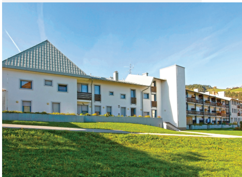
Slovenj Gradec, Šolska ulica 10, obnova objekta in dograditev dvigala, 2009

Nepremičninski sklad PIZ ima prosta naslednja najemna stanovanja, ki jih je možno ob izpolnjevanju pogojev takoj dobiti v najem: